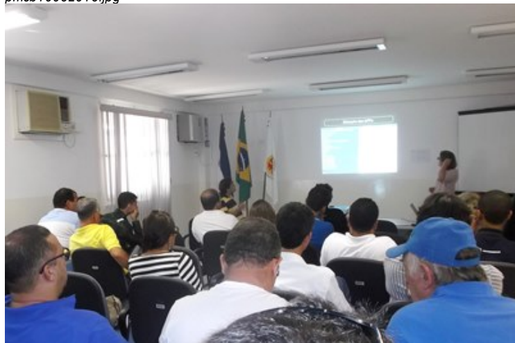
Sessão para aprovação do PMMA aconteceu no Auditório do Ministério Público Estadual, na Sede do município

A Administração Municipal através da Secretaria de Desenvolvimento Econômico e Meio Ambiente reuniu, na última segunda-feira (06), os membros do Conselho Municipal de Defesa do Meio Ambiente (COMDEMA) para a apresentação dos resultados parciais do Plano Municipal de Conservação e Recuperação da Mata Atlântica de Conceição da Barra (PMMA), a fim de obter aprovação do plano pelo COMDEMA.